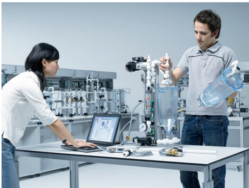
水处理过程控制实训系统 设备