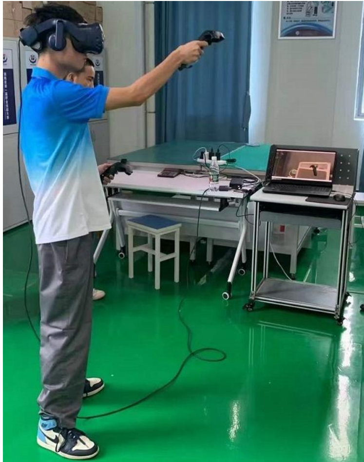
污水处理厂虚拟仿真实训系统